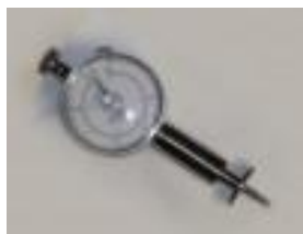
Penetrometro Para Frutas Luzeren Código: PRO1002533