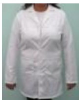
Bata Para Laboratorio CH Luzeren Código: PRO1002767