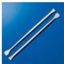
Varilla Agitador De Pp 244MM Kartell Código: KART828