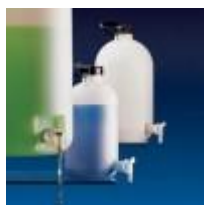
Garrafon Hdpe Con Llave 5, 10, 25 Y 50L Kartell Código: KART1666