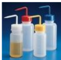
PICETA TAPA CLARA 250 Y 500ML Kartell Código: KART1637-00