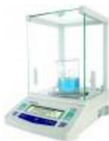
Balanza Analítica 320G Citizen Código: CX320