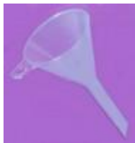
EMBUDO DE PLASTICO Luzeren Código: PRO1002201