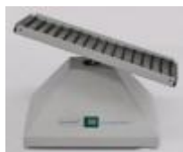
Agitador Angular Premiere Código: PRO1002693