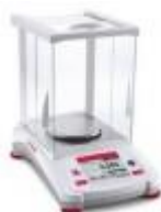
Balanza Analítica 220G Adventurer Ohaus Código: AX224