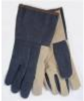
Guantes De Algodon 120°c Luzeren Código: PRO1002968