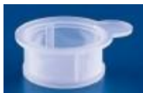
COLADOR CELULAR 70UM Falcon Código: FA352350