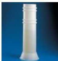
Jarra Vertical Kartell Código: KART218