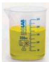
Vaso De Plástico Impresión En Azul Isolab Código: 026.03.025