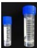
Criovial Conico 5ML Luzeren Código: PRO1001219