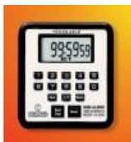
Reloj-cronometro 99 H Control Co Código: 5021CC