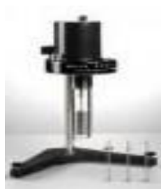
Viscosímetro Rotatorio Análogo Luzeren Código: PRO1002721