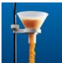
Embudo Para Polvos De Pp 180MM Kartell Código: KART166