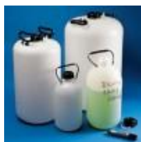
Garrafon Hdpe Redondo 5, 10, 25 Y 50L Kartell Código: KART1650