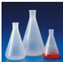
Matraz Erlenmeyer De Pp 125, 250 Y 500ML Kartell Código: KART1461