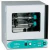
Horno De Hibridacion Labnet Código: H1200A