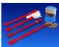
Espatula Doble Y Cuchara- Espatula 210MM Kartell Código: KART593