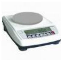
Balanza De Precisión 300G Citizen Código: CZ302