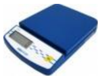
Balanza Compacta Dune 2000G Adam Código: DCT 2000