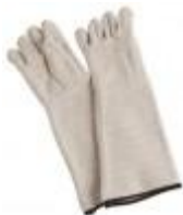
GUANTES PARA ALTAS TEMPERATURAS Heathrow Código: HS120483