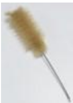
ESCOBILLON PARA VASO Luzeren Código: PRO1002635