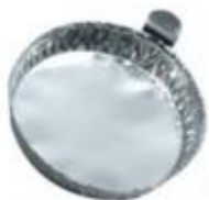
Charola De Aluminio 57*14MM Luzeren Código: PRO1002675