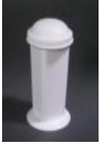
Vaso Coplin De Polipropileno Fisher Scientific Código: S17495A