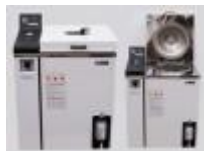
Autoclave Automática Vertical 100L Labtech Código: LAC-5100SD