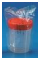
Frasco Esteril Para Muestra 150ml Kartell Código: KART5641