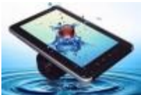
Camara Digital Touch 5.0 mpx Luzeren Código: PRO1002611