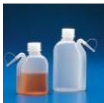
Piceta Integral De Pe 250 Y 500ML Kartell Código: KART1634