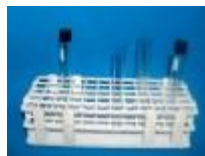
Gradilla De Polipropileno 16mm Luzeren Código: PRO1002647