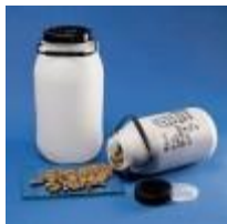
Garrafon Redondo Hdpe 5 Y 10L Kartell Código: KART1640