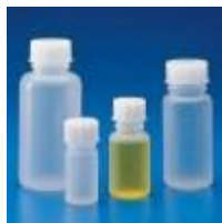
Frasco Graduado De Pe Autoclavable Kartell Código: KART1623