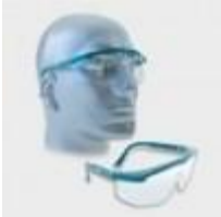
Lentes De Seguridad Isolab Código: 080.40.004