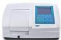
Espectrofotómetro Uv Visible Profesional Metash Código: PRO1001469