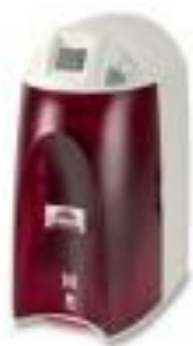
PURIFICADOR DE AGUA RIOS DI-3 UV S Merck Código: MZRDSVP3MX