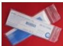
ASA DE POLIESTIRENO PARA SIEMBRA Biologix Código: 65-0001