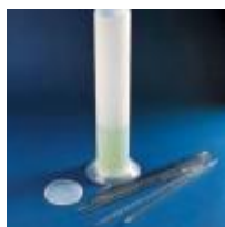
Estuche Polipropileno P/pipetas 82 DIAX426 MM Kartell Código: KART592