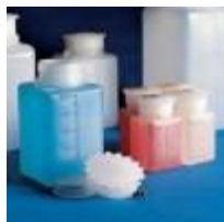
Frasco Pe Graduado Cuadrado 100, 250, 500, 1000 Y 2000ML Kartell Código: KART613