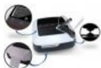
Espectrofotómetro Para Ácidos Nucleicos Maestrogen Código: PRO1002753