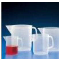
Jarra De Pp Graduada Forma Baja 500, 1000, 2000, 3000 Y 5000ML Kartell Código: KART1160