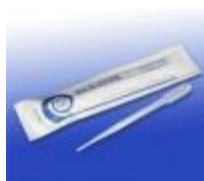
Pipeta De Transferencia 1ML Biologix Código: 30-0135A1