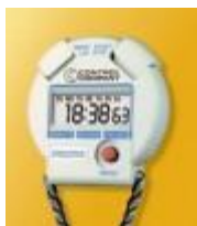
Cronometro / Cronógrafo Control Co Código: 1044CC