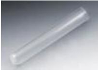
TUBO DE POLIPROPILENO Luzeren Código: PRO1001361