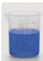
Vaso De Plastico Isolab Código: 026.01.025