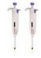
Micropipeta Autoclaveable 0.5-10ul Dlab Código: PRO1004048