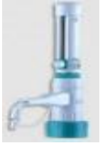
Dispensador De Liquidos 0.5-5 Isolab Código: 008.02.005