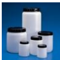
Frasco Hdpe Boca Ancha Kartell Código: KART1566