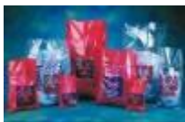
Bolsas Rojas De Polipropileno 35*47.5cm Fisher Scientific Código: 01-828B