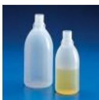
Botella De Pe Graduada Sin Tapa 1L Kartell Código: KART15881