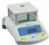
Balanza De Precision 450G Adam Código: PGW 453I