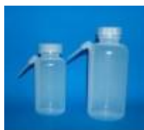
Piceta Boca Ancha 250 Y 500ML. Luzeren Código: PRO1002649