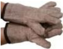
Guantes Para Objetos Calientes Luzeren Código: PRO1002934