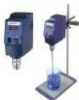
Agitador Mezclador De Propela Dlab Código: PRO1004074