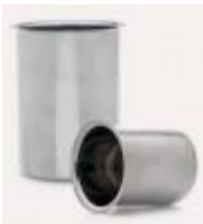
Vaso De Acero Inoxidable 100, 250, 500 Y 1000ml Isolab