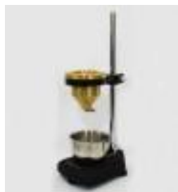
Viscosimetro Para Pinturas Luzeren Código: PRO1002937