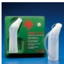
Lavaojos De Emergencia 500ML Kartell Código: KART2386