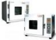
Horno De Vacio 27lts Labtech Código: LVO-2030