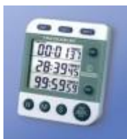
Reloj De 3 Canales Lcd Control Co Código: 5008CC