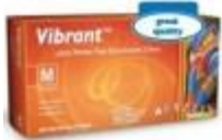
Guantes De Latex Aurelia Código: GU-98226-S