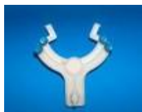
Pinza Sencilla Para 1 Bureta Luzeren Código: PRO1002640