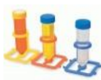
Soporte De Polipropileno Heathrow Código: HS23052