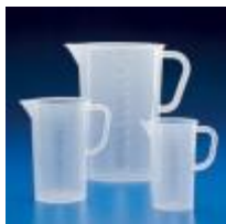
Jarra De Pp Graduada Forma Alta 1000, 2000 Y 3000ML Kartell Código: KART1090