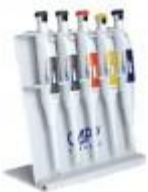
Micropipeta Digital Autoclaveable Capp 0.1-2UL Capp Código: CP-B02-1