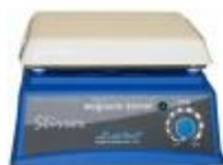
Agitador Magnético Labtech Código: LMS-1001