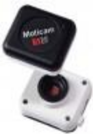
Camara Digital 5.0mpx MotiC Código: MC1100600100801