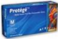
Guantes De Nitrilo Aurelia Código: GU-93997-M