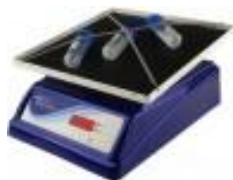
Agitador Angular Major Science Código: MS-NRK-30