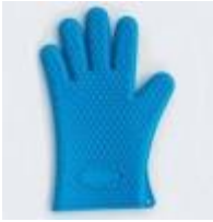
Guante De Silicon Isolab Código: 080.18.001