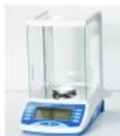
Balanza Analítica 120G Luzeren Código: PRO1001192