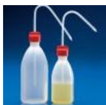
Piceta Pe Kartell 250, 500 Y 1000ML Kartell Código: KART185